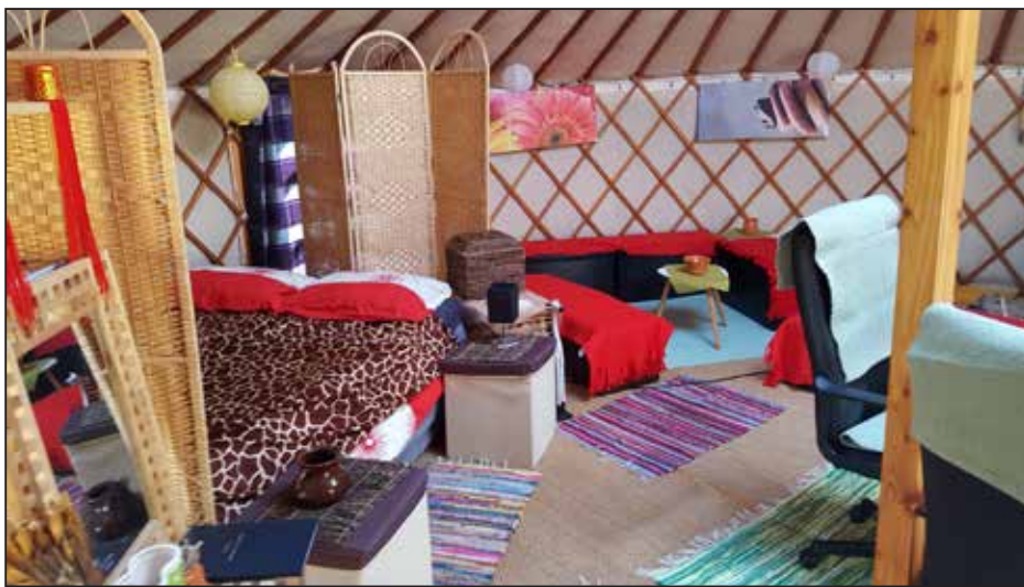
Jurte so danes vabljiva bivališča za različne generacije (jurta na Učnem poligonu za samooskrbo Dole).

Kaj je jurta? Jurta je okrogli premični šotor in spada v skupino bivališč, torej ima ugodne termične in izolacijske lastnosti. V takih domovih bivajo številna ljudstva v Srednji Aziji,