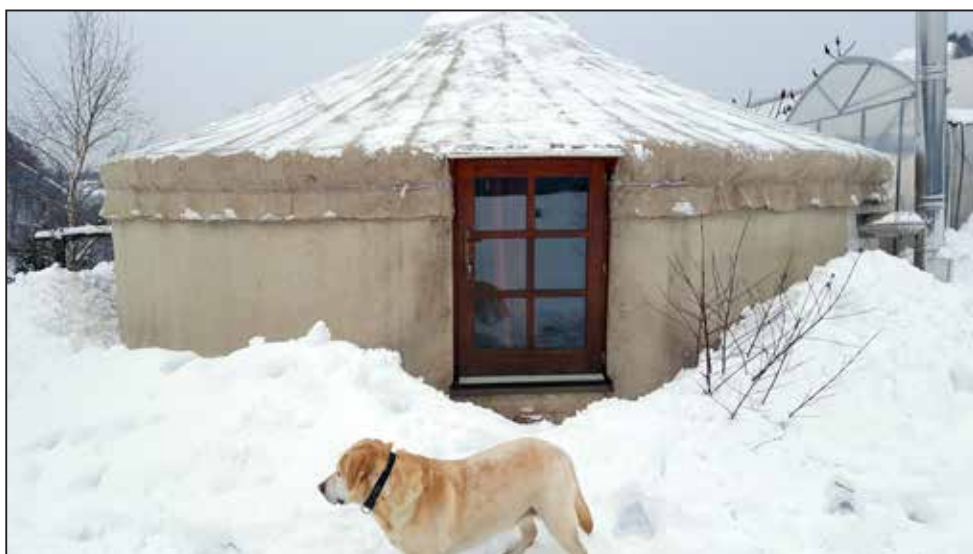
Jurta je idealno bivališče v vseh letih časih (Jurta na učnem poligonu za samooskrbo Dole, Poljčane).

Jurta je trajnostna zato, ker je povsem iz naravnih materialov, ki jih pridobimo doma (volna, les in konoplja) in jih ni potrebo uvažati. S tem poskrbimo tudi za okolje.