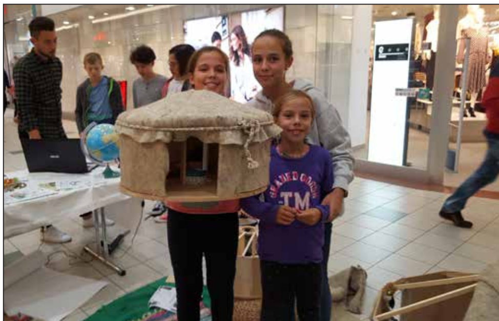
Z izkustvenim učenjem mladi pridobijo znanje za življenje.

S poznavanjem alternativnih možnosti bivanja, tako na podeželju kot v urbanih območjih, se počasi približujemo udejanjanju trajnosti, ki se mora začeti pri slehernem posamezniku.