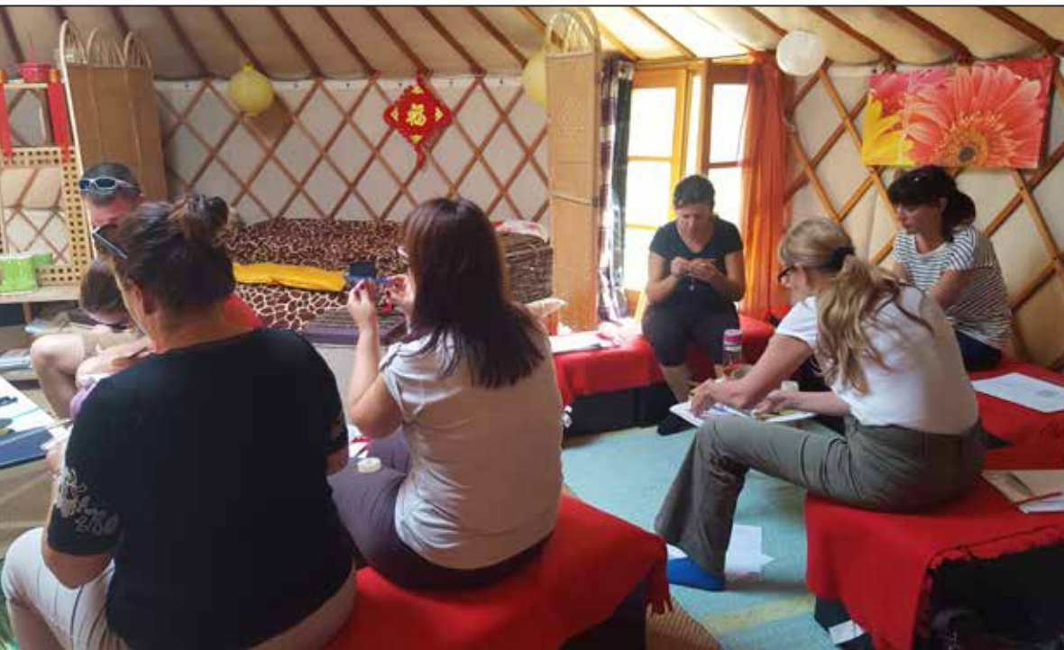
Notranjost jurte je prilagojena izobraževanju (jurta na Učnem poligonu za samooskrbo Dole, Poljčane)