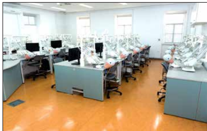
Študijski program Dentalna medicina bo potekal v učnih enotah fakultete, praktični del pa v Laboratorijskem centru Magdalena, kjer sta bodočim študentom na voljo dva odlično opremljena stomatološka laboratorija, darilo medicinskih fakultet iz Oula in Würzburga.