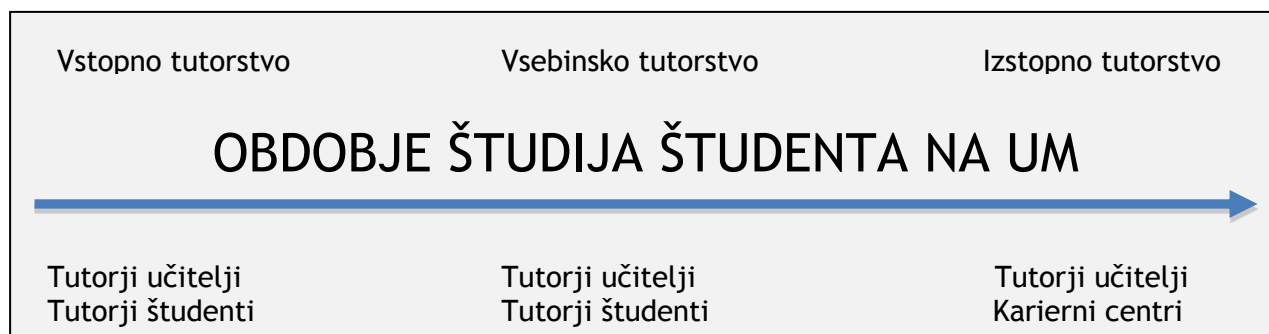
Slika 1: Oblike tutorstva na članici UM

Univerza v Mariboru (v nadaljevanju UM) želi oblikovati usklajen tutorski sistem z namenom vodenja, usmerjanja, motiviranja in pomoči študentom pri pridobivanju znanj in veščin, ki pripomorejo k njihovi večji akademski, obštudijski in osebnostni uspešnosti. Z vpeljavo tutorskega sistema želi UM zagotoviti aktivnejše vključevanje študentov v univerzitetno življenje ter pomoč pri razreševanju študijskih in življenjskih problemov na začetku študija (vstopno tutorstvo), med njim (vsebinsko tutorstvo) kakor tudi ob njegovem zaključevanju (izstopno tutorstvo).