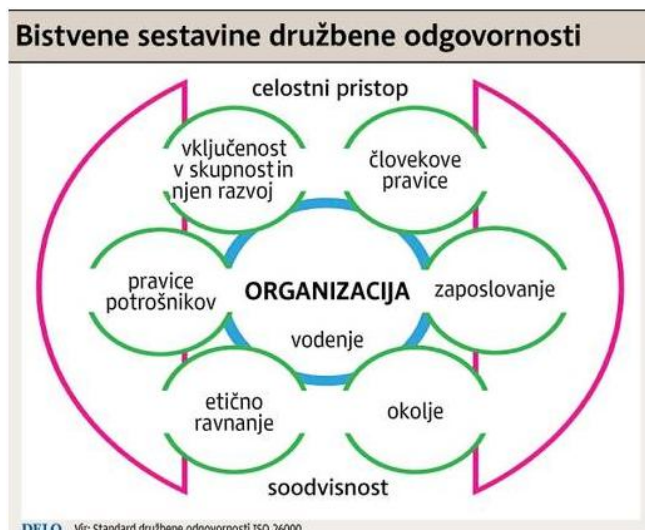
Slika 2: Bistvene sestavine družbene odgovornosti